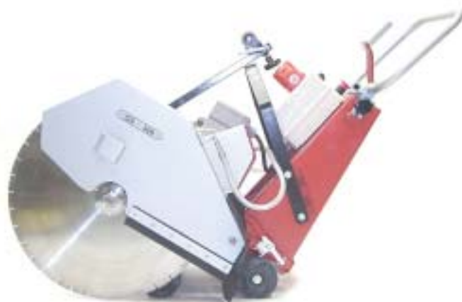
GS 500 m/Ø600 mm kappskive