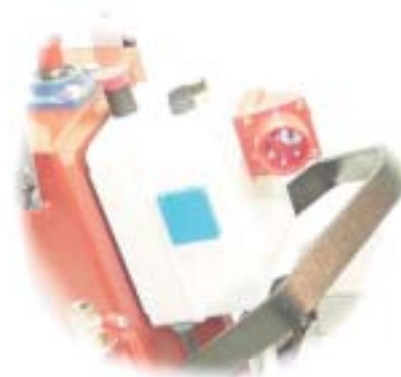
El. sentral m/nødstop, fasevender, strømuttak samt I-fas strømuttak (ekstraustyr)