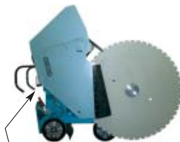
Slange og kabelholder samt støtte for kappskivedeksel ved skifte av kappskive