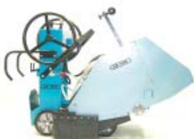
Maskinen kan leveres i flere ulike farger