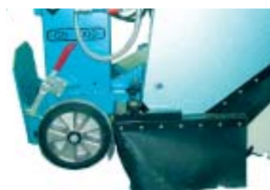
Ekstra stor skvettlapp er standard